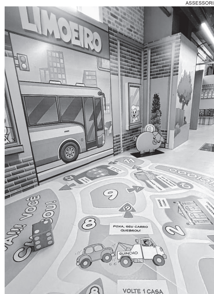
Funcionamento do espaço ocorre mediante agendamento prévio

Além do atendimento inicial aos estudantes da rede pública, a expectativa é de ampliação gradual do acesso ao espaço, permitindo que outros públicos também possam participar da experiência ao longo do tempo.